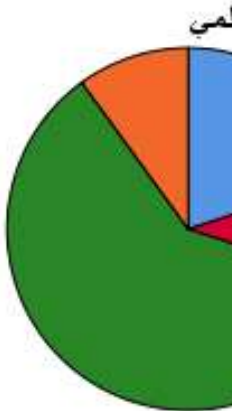
الشكل (1) يوضح توزيع العينة وفقا لمتغير المؤهل العلمي