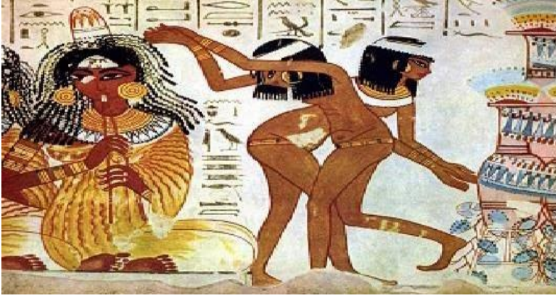
شكل (3): لوحة جدارية من مقبرة "نب آمون"، الأسرة 18، مشهد من الموسيقيين والراقصات، معبد الكرنك الأقصر، عهد الدولة المصرية الحديثة.*

لم تقتصر مناظر مقبرة نخت على مشاهد الحفلات، بل تضمنت أيضًا هواياته كصيد الطيور والأسماك فقد صُوِّر مشاهد توضح النبيل وهو يصطاد السمك، ويتضح اهتمام الفنان بدراسة الطبيعة رسمه حشرة السرمان والفراشة اللتين تحومان بين النبات (شكل 4) كما يظهر حبه لمحاكاة الطبيعة في رسم الطيور المذعورة من موكب الصيد. (17)