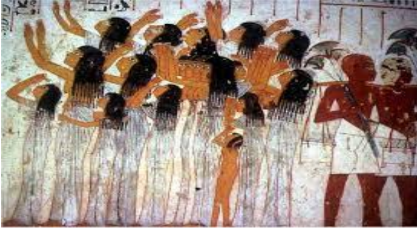
شكل (6): لوحة جدارية، من مقبرة رعموزي - عهد الأسرة 18، تصور السيدات الناحات مقابر النبلاء في البر الغربي بالأقصر، عهد الدولة المصرية الحديثة.*

حزينة يرفعن أذرعهن في الفضاء كتعبير علي الحزن أو هي طقوس دينية متبعة عند البكاء ( شكل 6 ) وقد توصل الفنان في انجازها إلي تحسين حالة الألم الشديد، بمختلف الحركات بالأيدي المرفوعة لأعلي، وبالدموع المنهمرة وبمظهر الصدور المكشوفة، وقد ظهرت فتاة صغيرة في الجهة اليسار من اللوحة، تساند إحدى السيدات (20) .