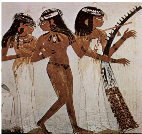
شكل (2): لوحة جدارية من مقبرة نخت، الأسرة 18، العازفات، مقابر النبلاء في البر الغربي بالأقصر، عهد الدولة المصرية الحديثة.*

تُعد مقبرة النبيل نخت*، كاهن الإله آمون في أواخر الأسرة الثامنة عشرة، نموذجًا بارزًا لدراسة مشاهد الاحتفالات المصوّرة، ففي إحدى جدارياتها يظهر حفل داخل قصر الأمير، يتضمن فرقة موسيقية مكونة من راقصة وعازفتين (شكل 2)، ويعكس هذا التصوير ما كان شائعًا آنذاك من إبراز الراقصات والفتيات الصغيرات في مثل هذه المشاهد. وتبرز قيمة العمل الفني في براعة الفنان المصري في إبراز التفاصيل الدقيقة للشعر والملابس، مع إتقان توزيع الألوان وإيجاد توازن بصري بين البني والأزرق (15)